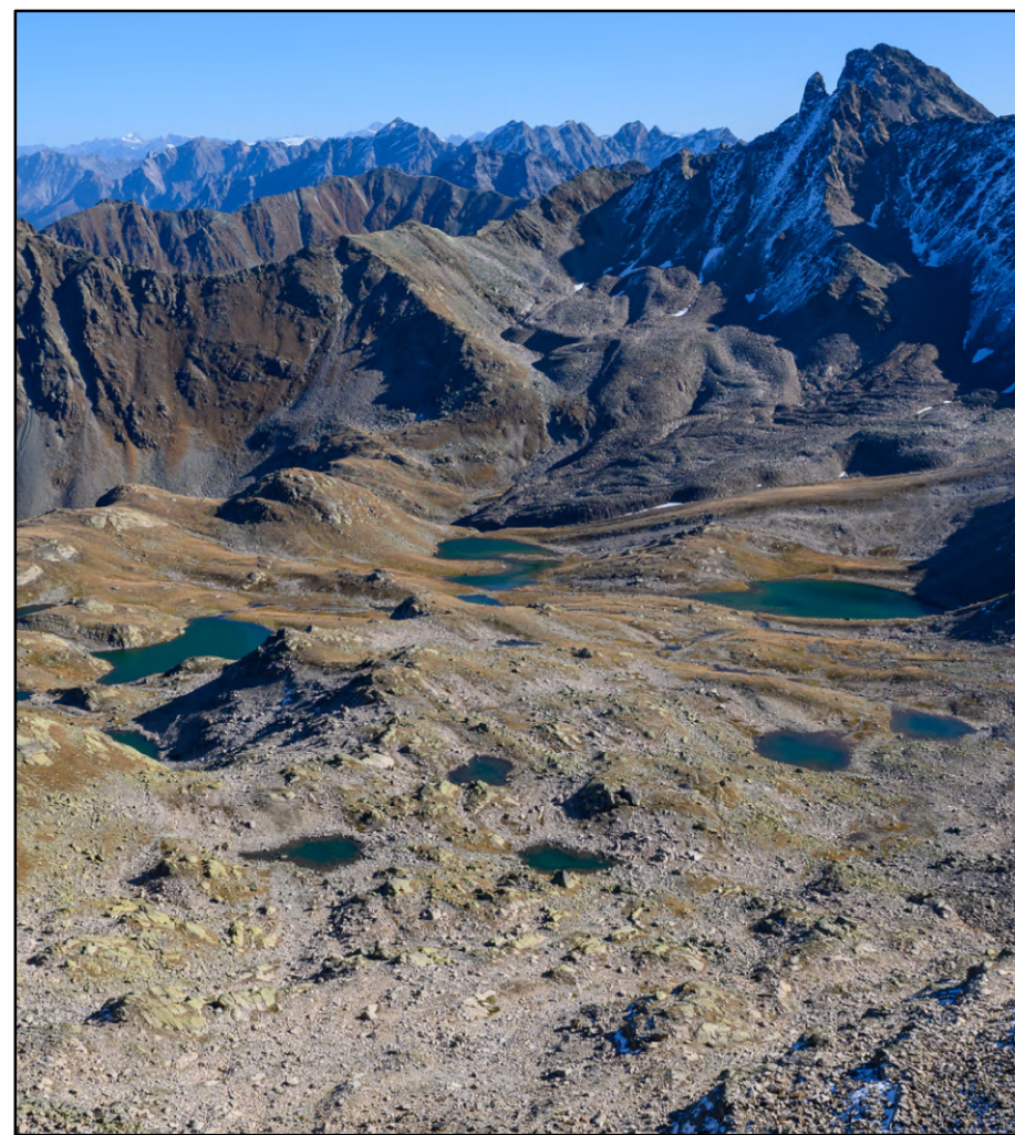
Macun Seenplatte im Schweizerischen Nationalpark mit dem Seen Lai da la Mezza Glina, Lai d'Immez und Lai Sura (grosse Seen von links), sowie dem imposanten Blockgletscher.