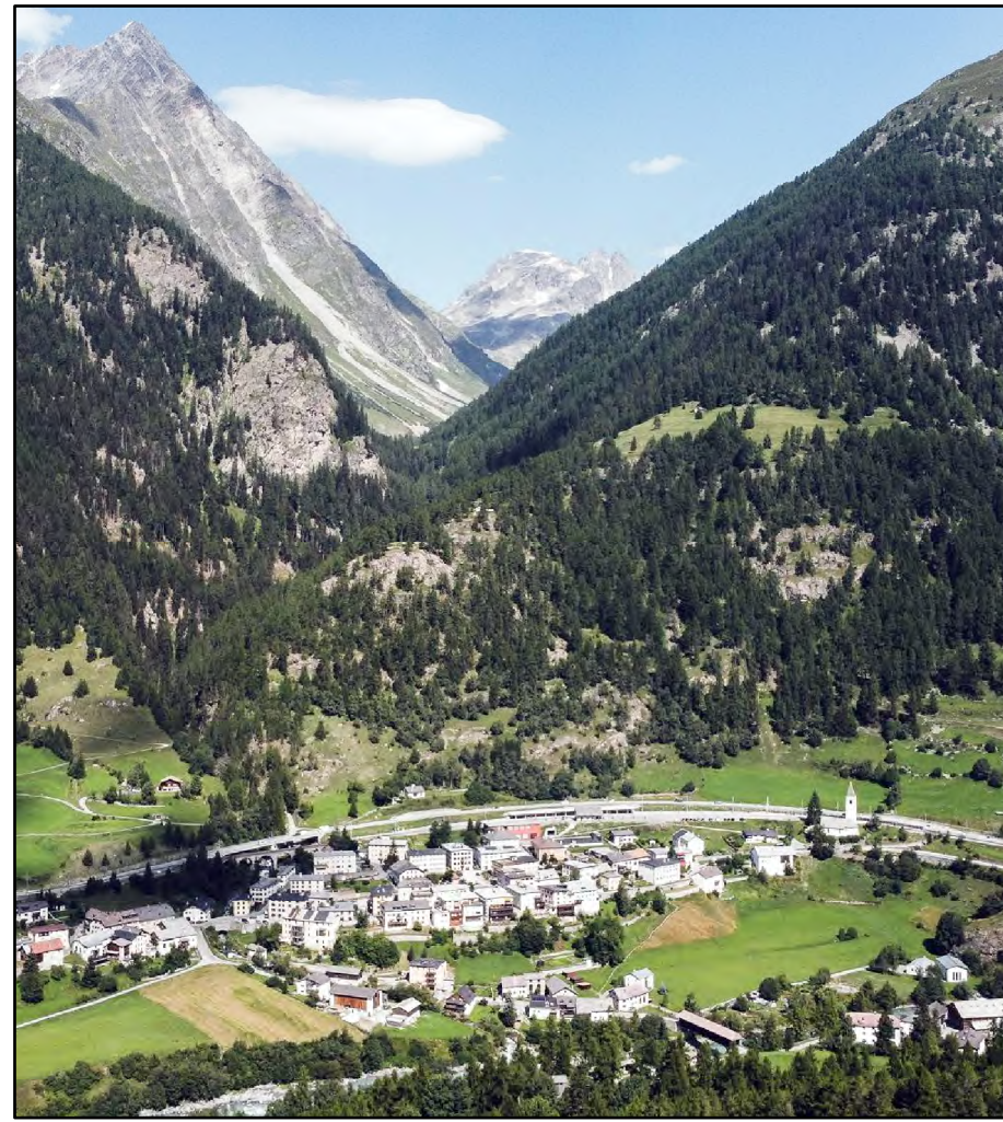
Lavin cul Piz Linard (3410 msm) e la Val Lavinoz.